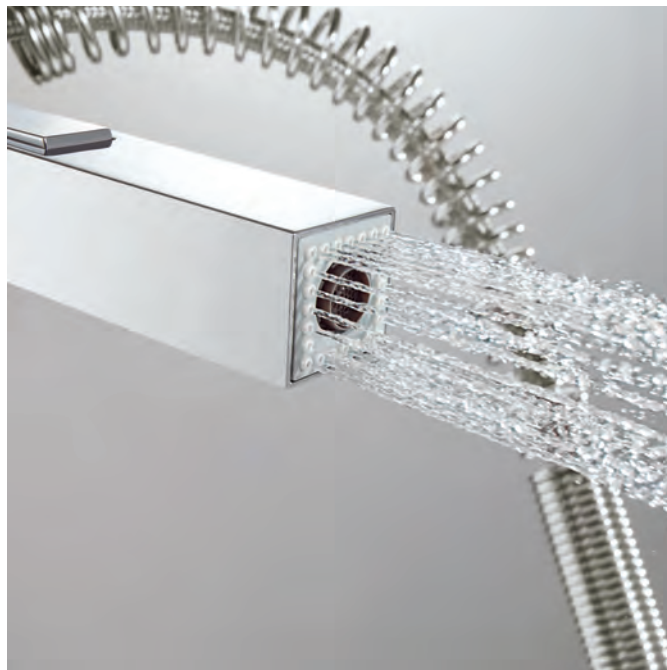
Душевая струя, образующая квадрат